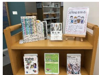
【9月21日は世界アルツハイマーデー】