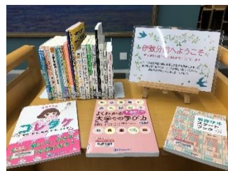
【レポートの書き方】