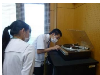
【オーディオルーム作業】