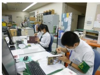
【本の受入・装備作業】