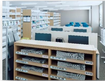
【伊敷キャンパス：図書館閲覧室】