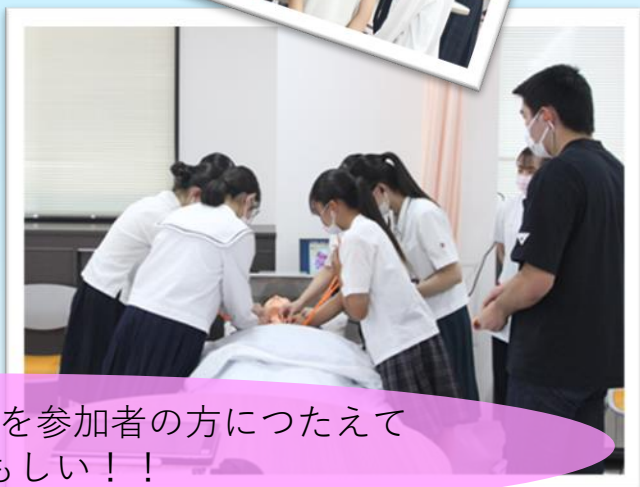
学生が講義で学習したことを参加者の方につたえています。頼もしい！！