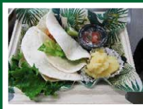
彩りランチボックス クッキング講座(6月)