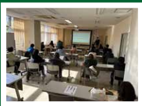
ミニセミナー 障害年金について(1月)

↑ 講座の詳細については、 http://www.kouryu-center.org/ に掲載しています。