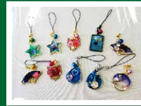
レジンストラップ てづくり講座(8月)