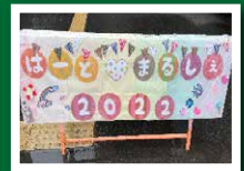
地域交流イベント はーと・まるしえ(11月)