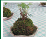
癒しのこけ玉つくり てづくり講座(5月)