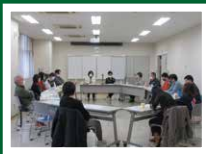
ピア学びの講座 ピアサポーター訓練生の リカバリストリー (1月)